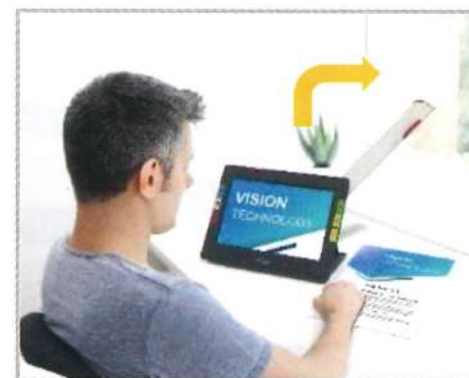
③フルページカメラ (アーム先端)

スタンドを開き、机・テーブル上に置いて使用します。書類の確認や写真を見たりするのに便利です。