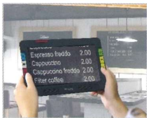
①遠方用カメラ (背面中央)