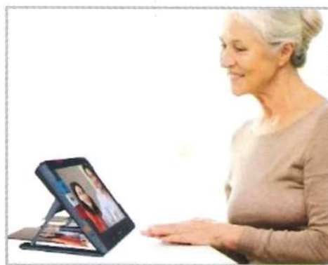
②拡大用カメラ (スタンド内側)

スタンドを開き、机・テーブル上に置いて使用します。書類の確認や写真を見たりするのに便利です。